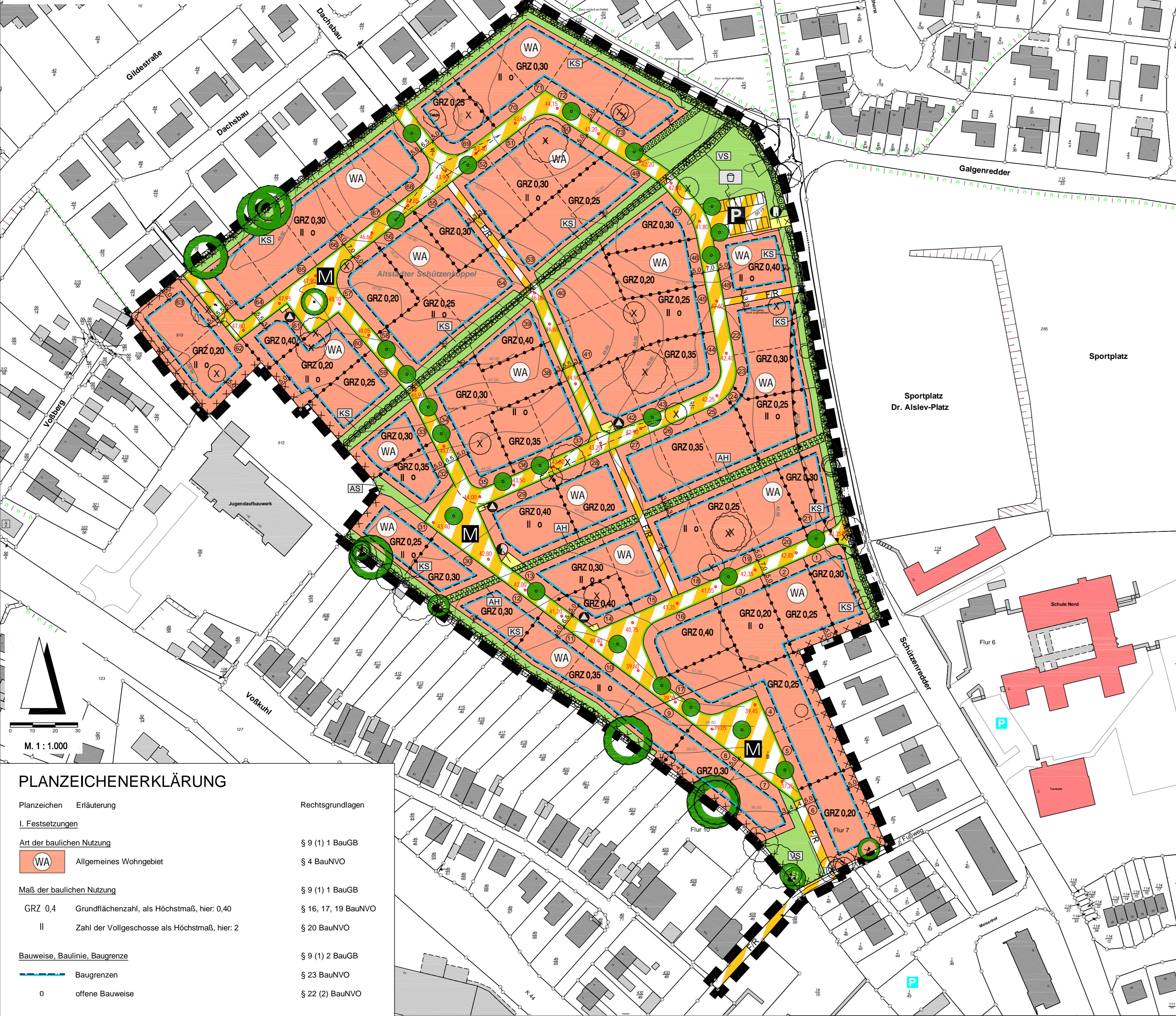
Planzeichnung (Teil A) Es gilt die BauNVO 2017/2021

Aufgrund des § 10 des Baugesetzbuches (BauGB) sowie nach § 86 der Landesbauordnung Schleswig-Holstein (LBO-SH) wird nach Beschlussfassung durch die Ratsversammlung vom ..... folgende Satzung über den Bebauungsplan Nr. 98 - Gebiet der ehemaligen Kleingartenanlage 'Altstädter Schützenkoppel', westlich Schützenredder, östlich Voßkuhl und südlich Dachsbau-, bestehend aus der Planzeichnung (Teil A) und dem Text (Teil B) erlassen.