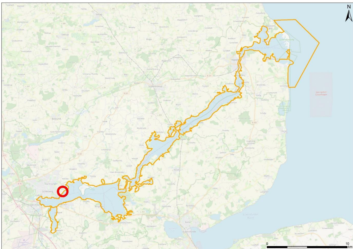
Abbildung 1: Lage und Abgrenzung des Vogelschutzgebietes DE 1423-491 „Schlei“ mit Kennzeichnung des Plangeltungsbereichs (roter Kreis). Kartenhintergrund: OpenStreetMap, M 1:150.000.

Eine Übersicht über das Schutzgebiet gibt die folgende Abbildung 1.