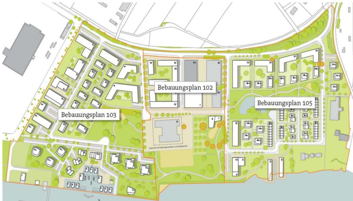
Abbildung 2: Lageplan Quartier "Auf der Freiheit" (SGEG 2020, Stand 12.03.2020).

Auf dem Gesamtgelände der ehemaligen Kasernenfläche „Auf der Freiheit“ soll ein neues Quartier und ein neuer Stadtteil Schleswigs entstehen. Die verschiedenen Bereiche sind nach einer gesamtheitlichen städtebaulichen Konzeption und Planung in 3 Bebauungspläne eingeteilt (vgl. Abbildung 2).